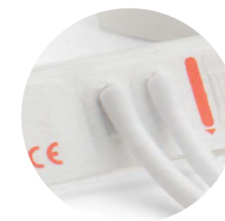
Bracciale monouso per neonati a due tubi