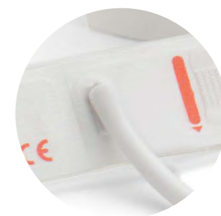
Bracciale monouso per neonati a un tubo